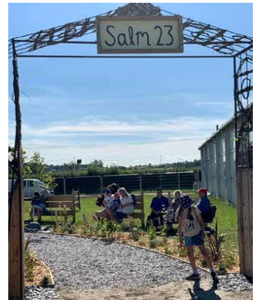
Tu allan i'r babell, dan nawdd Cymdeithas y Beibl, roedd yna ardd Feiblaidd, wedi ei hysbrydoli gan ardd o Sioe Flodau Chelsea. Trwy glicio ar ddolen i wefan ar eich ffôn, roedd modd gwrandao ar fyfyrddod pum munud yn esbonio ystyr ac arwyddocâd Salm 23.