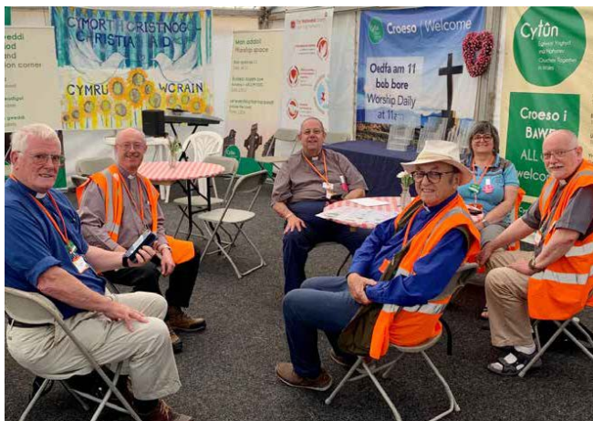
Y caplaniaid cyn cychwyn allan ar waith y dydd

Diolch am weledigaeth Tir Dewi, ac am eu hawydd i weithio ar draws yr enwadau i gynnig gwasanaeth i bawb mewn angen. Diolch hefyd am waith a thystiolaeth yr eglwysi ar faes y Sioe – a braff fyddai gobethio, erbyn 2023, y bydd mwy o blith eglwysi anghydfurfiol Cymraeg Cymru yn ymuno yn y genhadaeth. Tybed a yw Duw yn eich galw CHI?