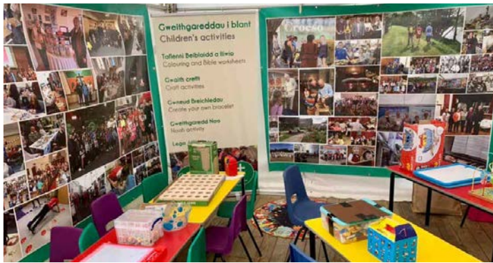
Cornel gweithgaredd y plant – braf fu cael cyfeillion o fudiad Plant Dewi yn gwirfoddoli gan drefnu amrywiaeth o grefftau a gweithgareddau ar gyfer y plant.