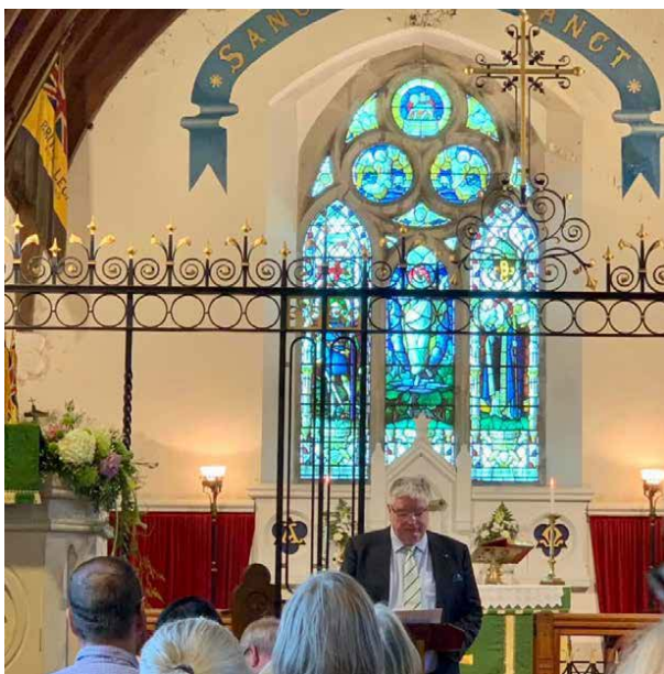
Traddodiad eisteddfodol blynyddol yw'r offeren o dan nawdd yr Eglwys Gatholig, a gynhaliwyd eleni yn Eglwys y Santes Fair yn Nhrefarfon.