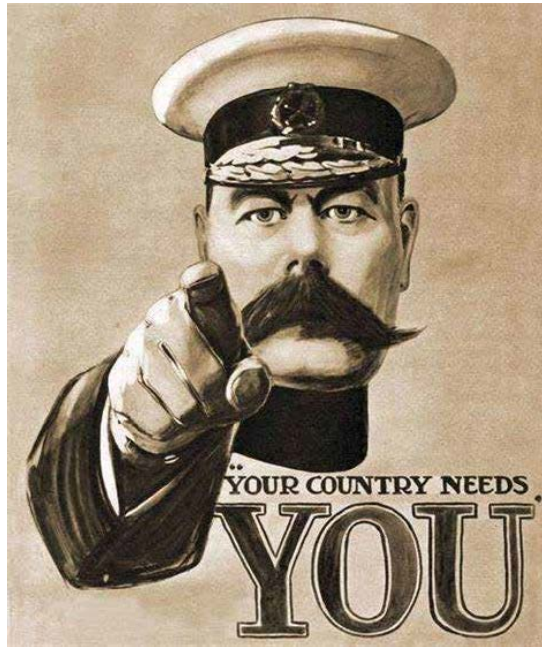
Adleisiau o alwad dychrynlyd y Rhyfel Byd Cyntaf i'w gweld ar faes y Sioe eleni

Mae'r cysylltiad rhwng y Sioe a'r fyddin yn hanesyddol wedi bod yn un glòs, â nifer o sioeau ceffylau'n diddori'r dorf sawl gwaith y dydd, a thanio'r gynnuau'n digwydd yn rheolaidd, heb anghofio am hedfaniadau dyddiol y Spitfires uwch maes y Sioe. Mae'n debyg fod dros 250 o wirfoddolwyr milwrol yno, gan gynnwys plant a phobl ifanc y cadetiaid. Roedd y stondinau hyn yn rhai byrlymus a hwyliog iawn, a thorfeydd o deuluoedd yn ymgasglu